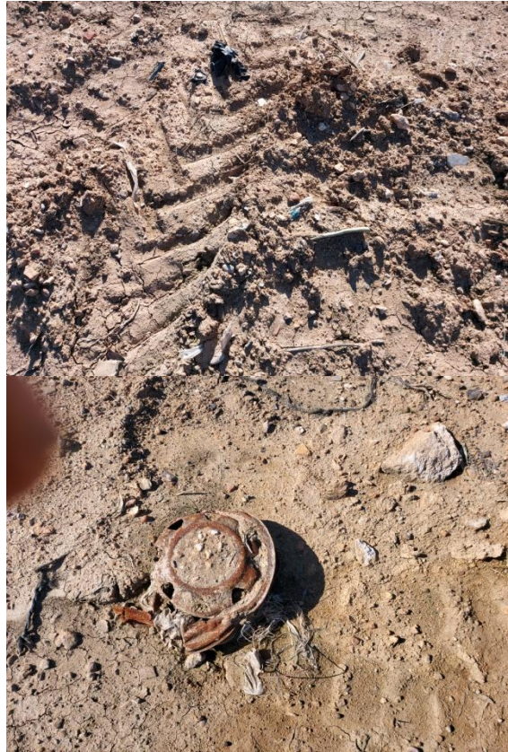
Detalles de la visibilidad del terreno.