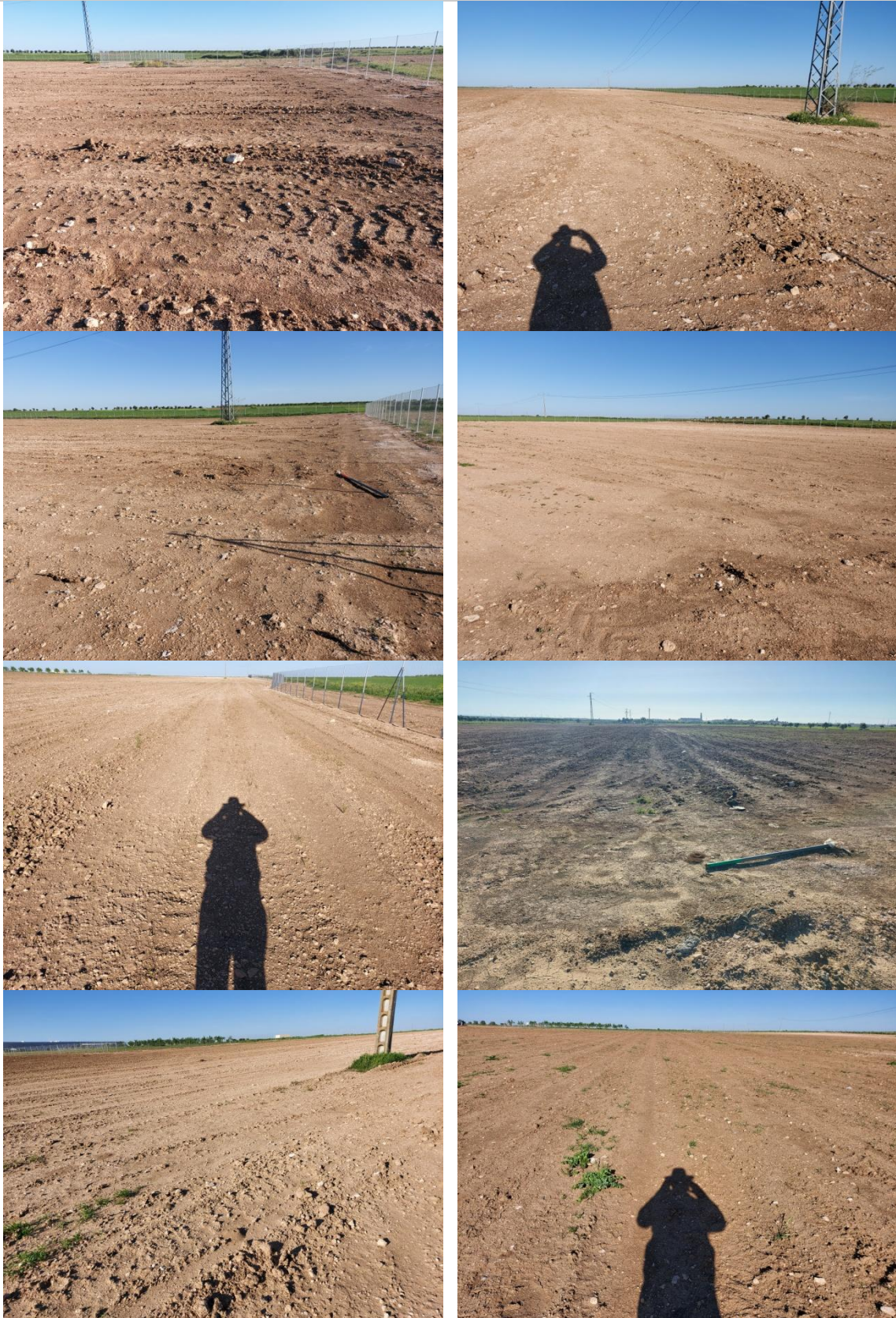
Fotografías del aspecto general del área de afección de las obras, tomadas de Norte a Sur. Mitad Norte.