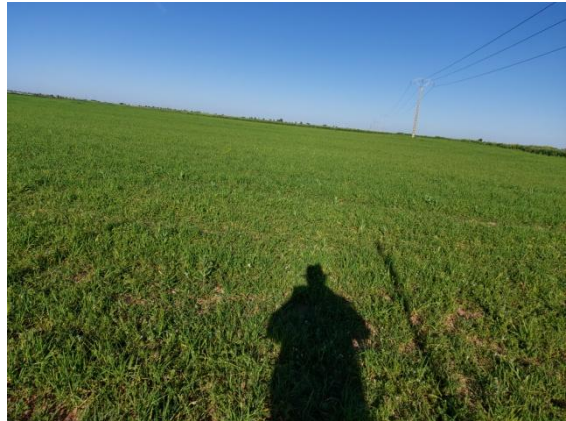
Aspecto de una parcela contigua sembrada.