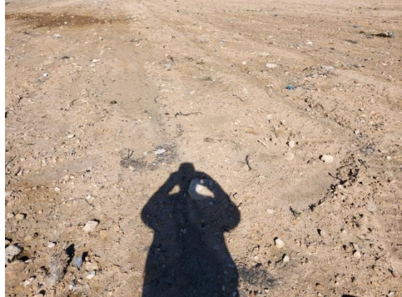
Fotografías del aspecto general del área de afección de las obras, tomadas de Norte a Sur. Mitad Sur