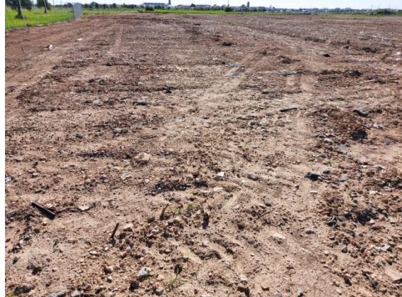
Detalles de la visibilidad del terreno.