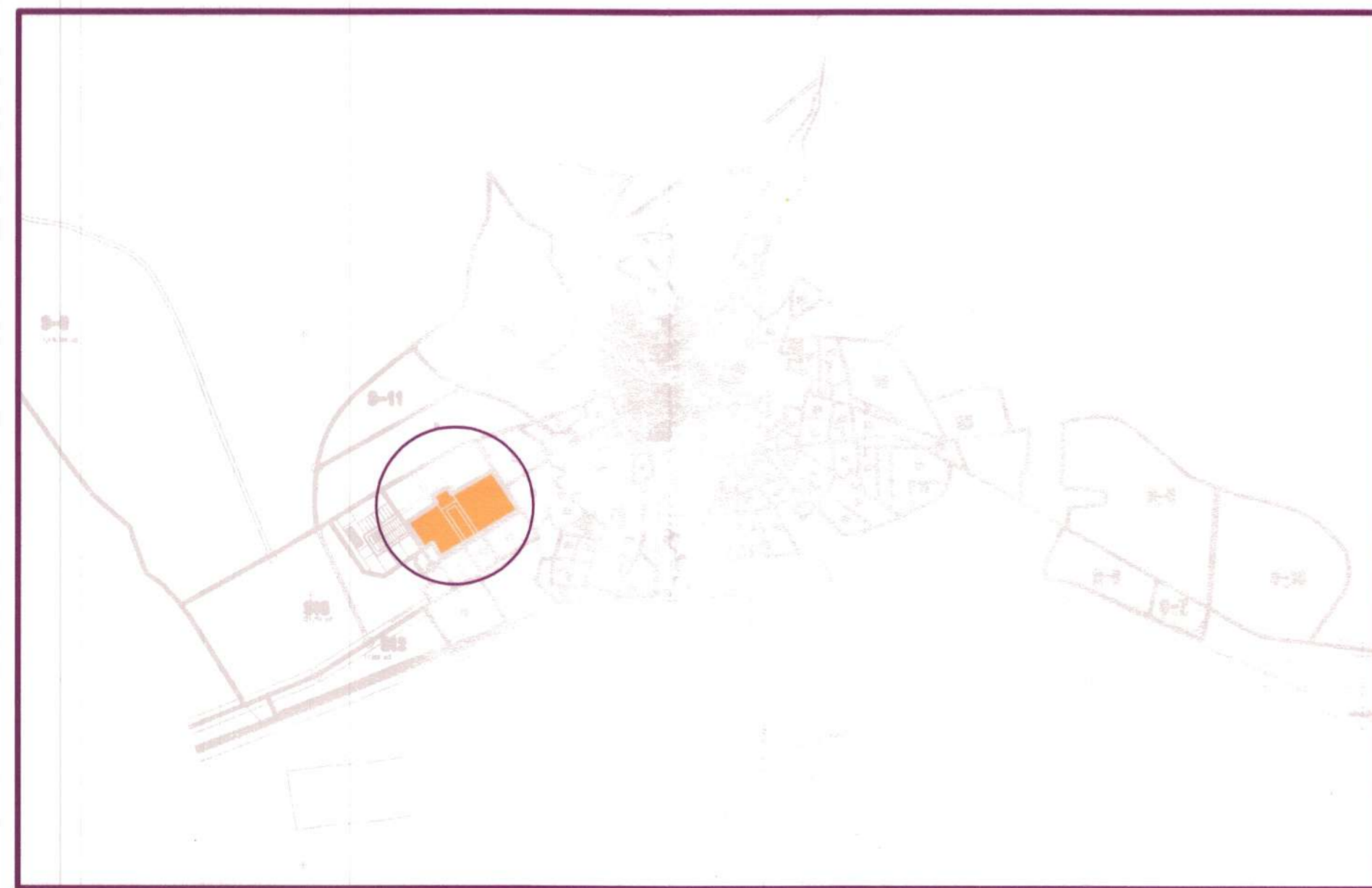
PLANO DE SITUACION

AYUNTAMIENTO DE NOBLEJAS DILIGENCIA: Para hacer constar que el presente documento coincide fielmente con el aprobado inicialmente por el Pleno Municipal en la sesión del 09-12-2007 DOY FE. Noblejas, 29-05-2010 El Secretario. Fdo: Antonio Zambrano Jiménez (TOLEDO)