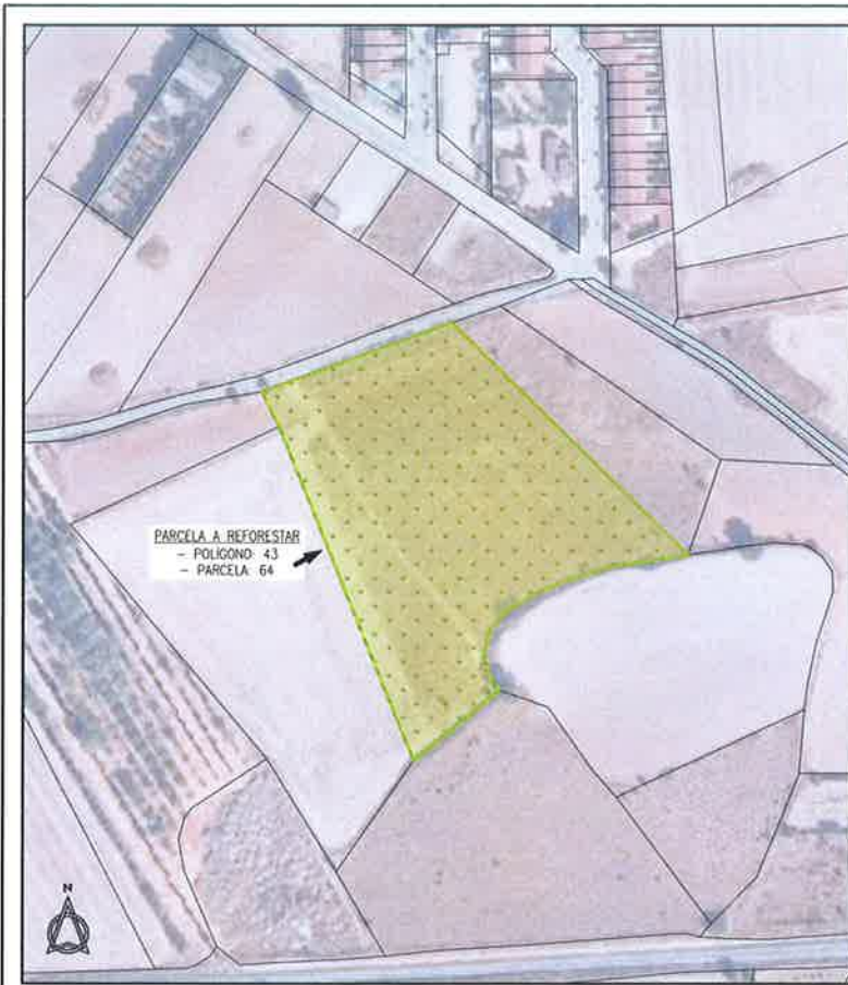
02 EMPLAZAMIENTO PARCELA A REFORESTAR E:1/1500

AYUNTAMIENTO DE NOBLEJAS (Toledo) REGISTRO DE ENTRADA N.º 4980 Fecha 30-07-2020